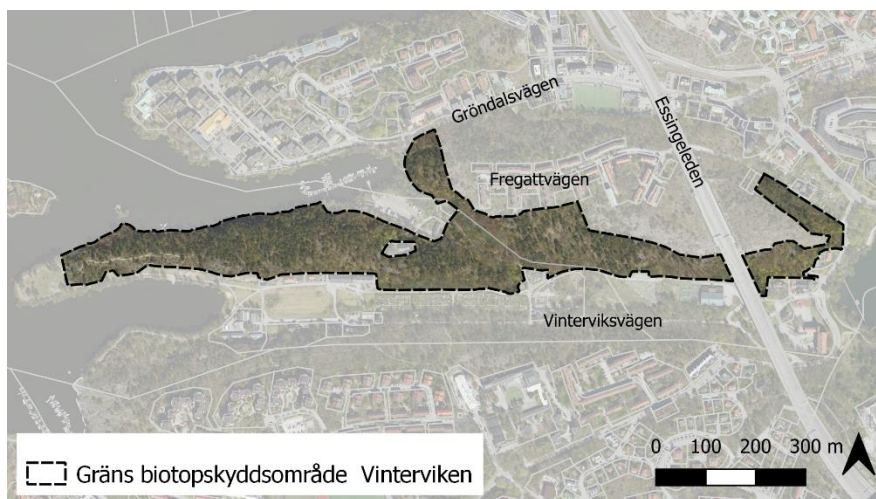
Figur 2. Förslagen avgränsning av biotopskyddsområde Vinterviken (SBK).

Genom förslagen avgränsning kommer ett stort antal grova ekar samt deras efterföljare att skyddas. Därmed bevaras en mycket viktig del av det såväl regionala som kommunala eksambandet långsiktigt. Genom att även inkludera värdefulla tallmiljöer skyddas även en viktig del av stadens barrskogs nätverk.